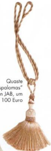
Quaste "Maspalomas" von JAB, um 100 Euro