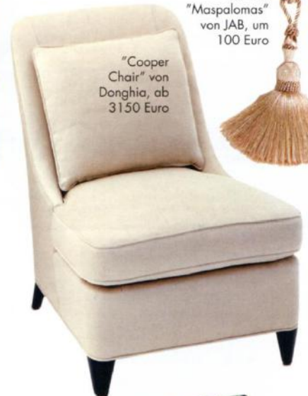
"Cooper Chair" von Donghia, ab 3150 Euro