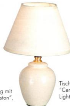
Tischleuchte "Ceramic" von Esto Lighting, P. a. A.