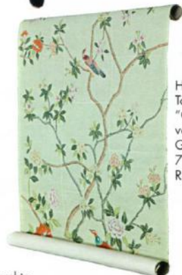
Handbemalte Tapete "Chatsworth" von de Gournay, ab 750 Euro/Rolle