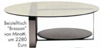
Beistelltisch "Bresson" von Minotti, um 2280 Euro