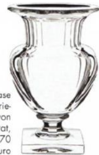
Kristallvase "Marie-Louise" von Baccarat, um 1070 Euro