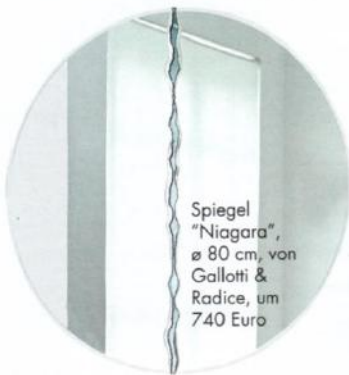
Spiegel "Niagara", ø 80 cm, von Gallotti & Radice, um 740 Euro