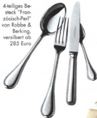
4-teiliges Besteck "Französisch-Perl" von Robbe & Berking, versilbert ab 285 Euro