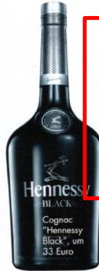
Cognac "Hennessy Black", um 33 Euro

Über seine Mode sagte der US-Designer einmal: "Die Kernfrage, die ich mir stelle, lautet: Wo würde Cary Grant heutzutage einkaufen?" Tom Ford hat den Gentleman ins 21. Jahrhundert hinübergerettet. Das bedeutet fürs Interior: Edle Braun- und Kohletöne gesellen sich zu Silber; Rauchglas und Kristall sorgen für entspannte Clubatmosphäre. Mußestunden sind wieder gesellschaftsfähig, z. B. zum Briefeschreiben oder Spielen. Cary Grant hätte seine Freude!