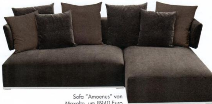
Sofa "Amenus" von Maxalto, um 8940 Euro