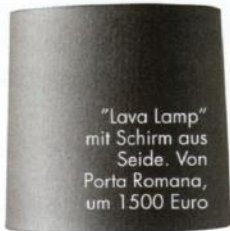
"Lava Lamp" mit Schirm aus Seide. Von Porta Romana, um 1500 Euro