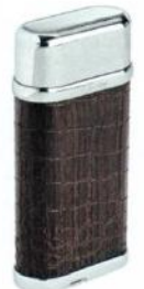
Feuerzeug aus Ebenholz mit Alligatorgravur. Von Cartier, um 600 Euro