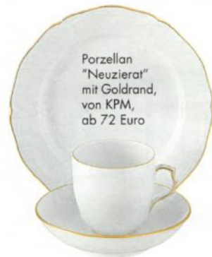
Porzellan "Neuzierat" mit Goldrand, von KPM, ab 72 Euro