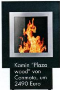
Kamin "Plaza wood" von Conmoto, um 2490 Euro