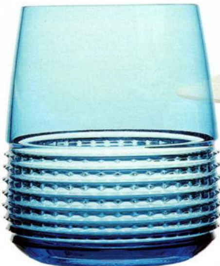
Aquamarin Das Relief des Bechers aus der Serie „Intervalle“ ist den Facetten des Diamantschliffs nachempfunden. 9 x Ø 6,5 cm, ca. 130 €, Artedona