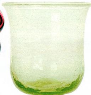
Smaragd Der nostalgische geschwungene Weinkelch aus Recyclingglas präsentiert sich in zartem Grün. 17 x Ø 8,5 cm, ca. 12 €, House Doctor