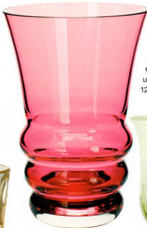
Rubin „Marlene“ aus Kristallglas verwandelt Wasser in einen edlen Trunk. Auch klar, in Pink und Grapefruit-Orange erhältlich, 12,4 cm hoch, ca. 47 €, Theresienthal

Sie fangen das Licht ein und funkeln in leuchtenden Edelsteintönen: Gläser bringen neben Farbe den gewissen Feinschliff auf den Tisch