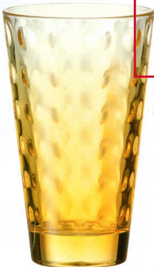
Citrin Oberflächenstruktur und der Verlauf in Gelb machen Becher „Optic“ zum Blickfang auf jeder Tafel. 13 x Ø 8 cm, ca. 3 €, Leonardo