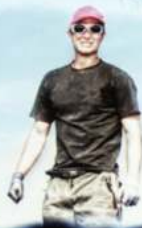
„Ice“, 90 m, Platz 39