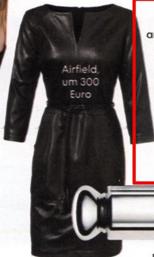
Airfield, um 300 Euro