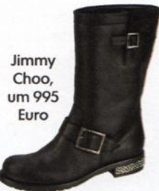
Jimmy Choo, um 995 Euro

Nicht nur die Outfits der Saison zeigen sich düster und verrückt, auch Möbel haben jetzt Hardrock-Appeal. Inspirationsquelle vieler Designer? Stieg Lars-sons Romanheldin Lisbeth Salander in der Krimiverfilmung "Verblendung". Wichtigste Merkmale: Nieten, Tattoos, Leder – und natürlich die Farbe Schwarz!