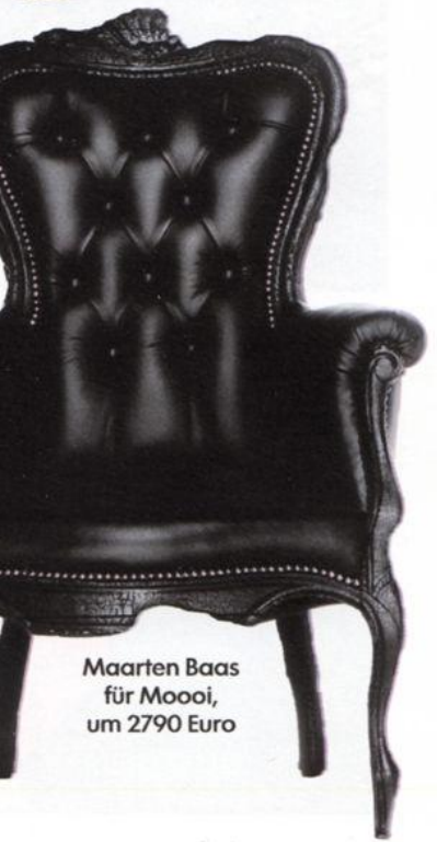
Maarten Baas für Moooi, um 2790 Euro