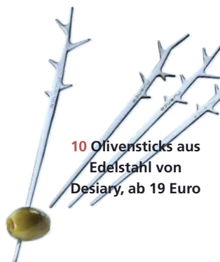
10 Olivensticks aus Edelstahl von Desiary, ab 19 Euro