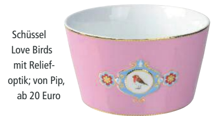
Schüssel Love Birds mit Relief-optik; von Pip, ab 20 Euro