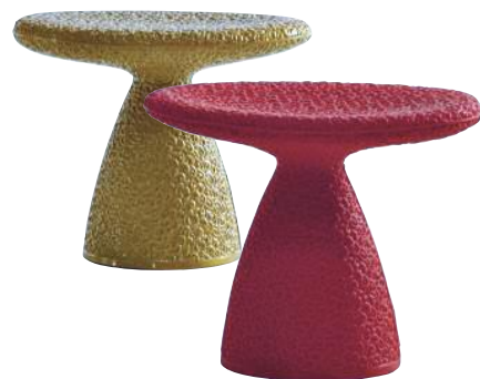
5 Pilzförmiger Hocker von Moroso, ab 250 Euro