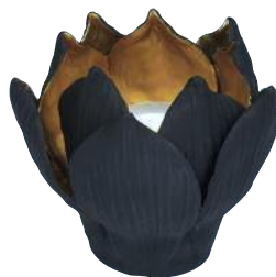
4 Vesuvio Teelichthalter von Lambert, 40 Euro