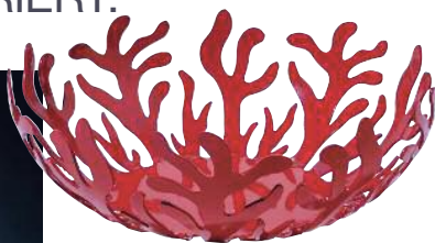
3 Rote Korallenschale von Desiary, ab 50 Euro/Stück