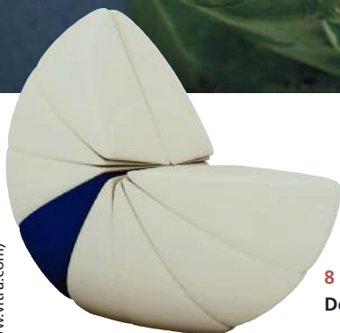
8 Lu von Sand & Birch Designs, 3.000 Euro