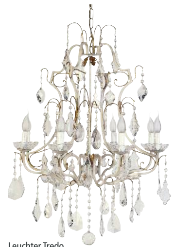
Leuchter Tredo von Domicil, ab 4.000 Euro