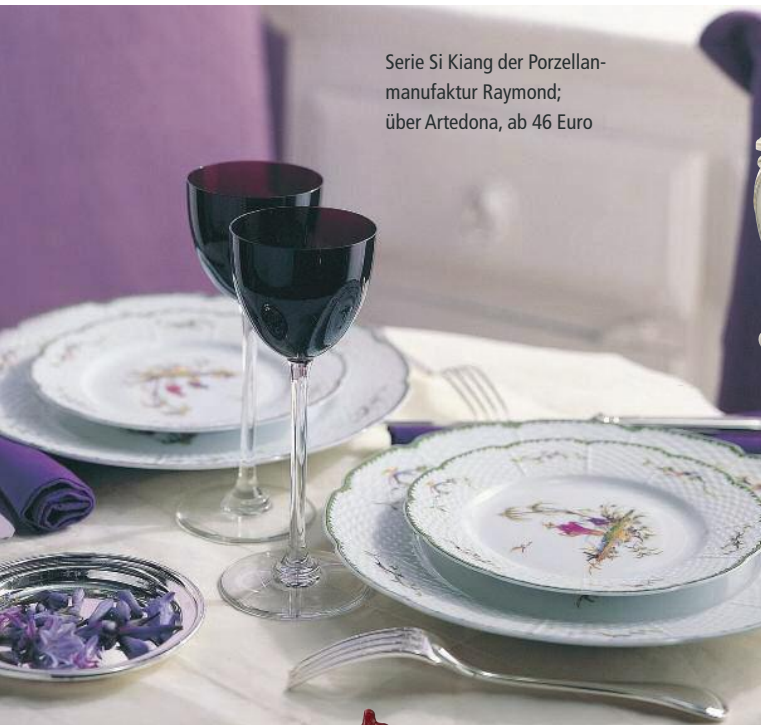
Serie Si Kiang der Porzellanmanufaktur Raymond; über Artedona, ab 46 Euro

Laden Sie Ihre Freunde zu einem eleganten Dinner ein! Wir präsentieren passende Accessoires im britischen Stil.