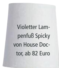
Violetter Lampenfuß Spicky von House Doctor, ab 82 Euro