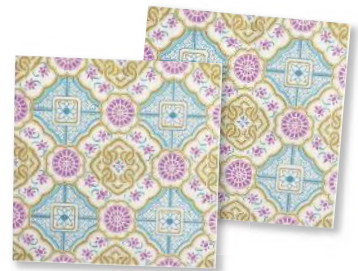
Servietten Albertus von House Doctor; 20 Stück ab 3 Euro