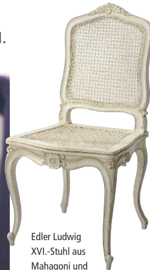
Edler Ludwig XVI.-Stuhl aus Mahagoni und Peddigrohr; von Car, ab 179 Euro