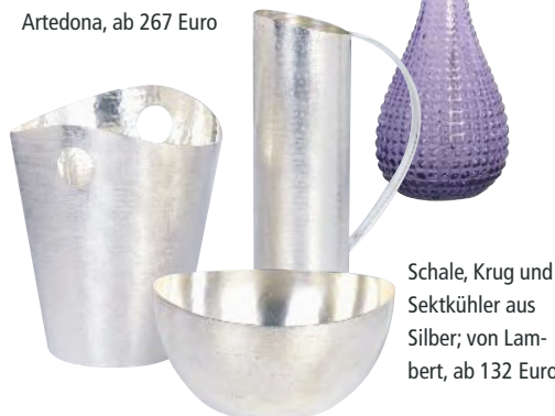
Schale, Krug und Sektkühler aus Silber; von Lambert, ab 132 Euro