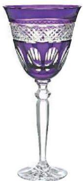
Geschliffener Kristallkelch von Impressionen, 50 Euro