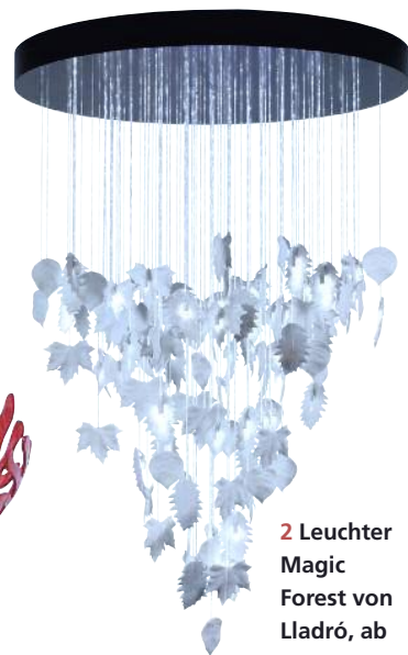
2 Leuchter Magic Forest von Lladró, ab 15.500 Euro