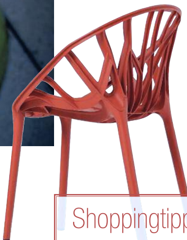
7 Stuhl Vegetal, über Vitra, ab 372 Euro