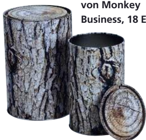
9 Keksdosen von Monkey Business, 18 Euro