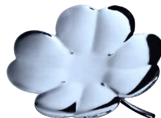
6 Versilbertes Schälchen Trèfle von Christofle, ab 180 Euro