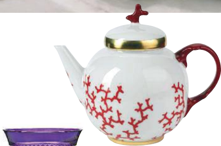
Teekanne Christobal mit Korallenmotiv; von Artedona, ab 267 Euro