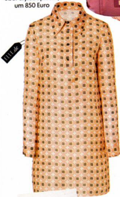
Jil Sander Navy, über stylebop.com, um 850 Euro