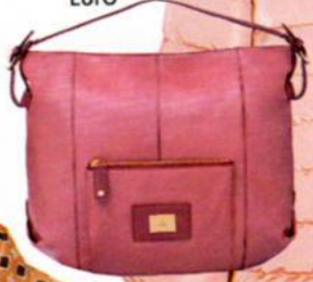
Aigner, um 650 Euro