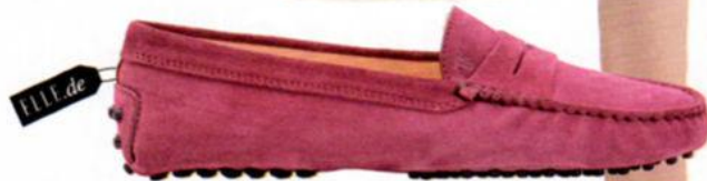
Tod's, über mytheresa.com, um 315 Euro