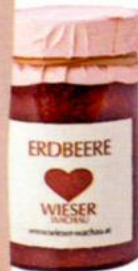
Erdbeerkonfitüre von Wieser Wachau, über manufactum.de, um 7 Euro