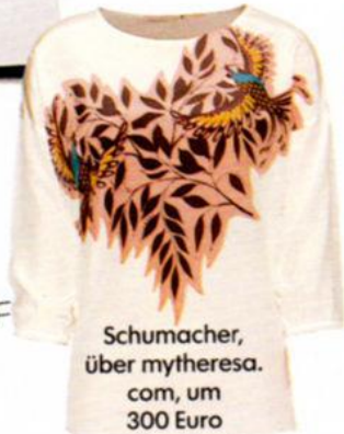
Schumacher, über mytheresa.com, um 300 Euro