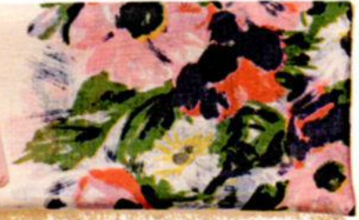
Tuch von By Malene Birger, um 95 Euro