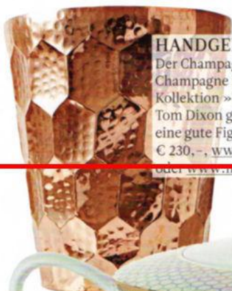
HANDGEMEISSELT Der Champagnerkühler »Hex Champagne Bucket« aus der Kollektion »Eclectic« von Tom Dixon gibt auch als Vase eine gute Figur ab. Preis: ab ca. € 230,-, www.tomdixon.net oder www.moodwien.at .

Preis: Canape Plates im 4er-Set um € 161,-. Dessert Plates im 4er-Set um € 216,-. Gabel/Löffel im 4er-Set um € 114,-. Stoff um € 420,- pro Meter. Erhältlich bei Steinwender. www.viktorsteinwender.at