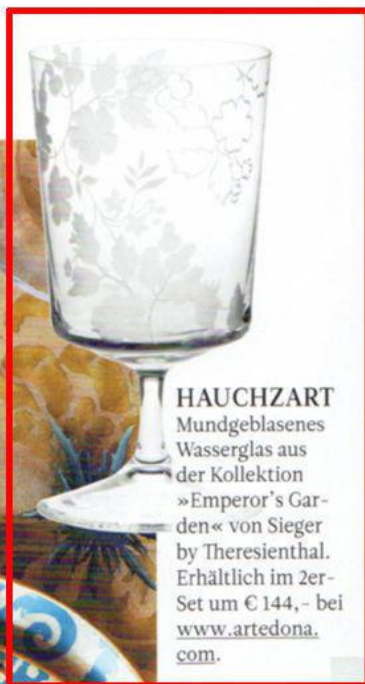
HAUCHZART Mundgeblasenes Wasserglas aus der Kollektion »Emperor's Garden« von Sieger by Theresienthal. Erhältlich im 2er-Set um € 144,- bei www.artedona.com .