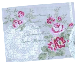
Baumwoll-Platzset zum Wenden; von GreenGate, 10 Euro