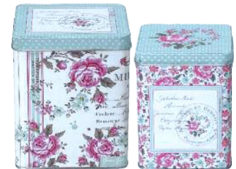
Blechdosen mit Blütenprint; von GreenGate, 22 Euro/2-er Set