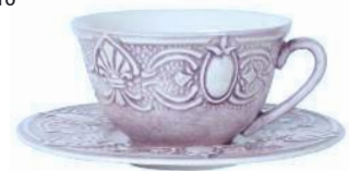
Teetasse Aladeco aus Keramik; von Zara Home, 7 Euro