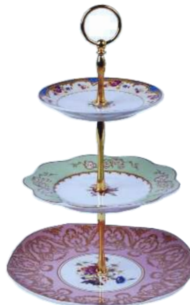
Etageres Regency; über Nostalgie im Kinderzimmer, 40 Euro