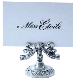
Nostalgischer Kartenhalter; von Miss Etoile, ab 6 Euro