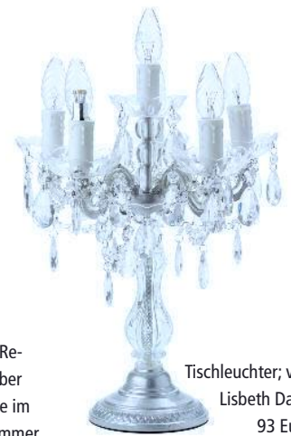
Tischleuchter; von Lisbeth Dahl, 93 Euro