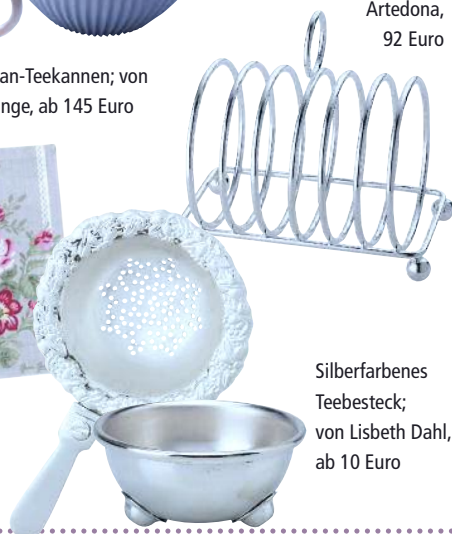
Silberfarbenes Teesieb; von Lisbeth Dahl, ab 10 Euro