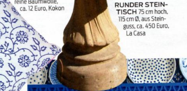
RUNDER STEINTISCH 75 cm hoch, 115 cm Ø, aus Steinguss, ca. 450 Euro, La Casa