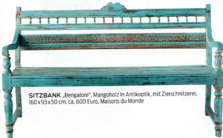
SITZBANK „Bengalore“ , Mangoholz in Antikoptik, mit Zierschnitzerei, 160 x 93 x 50 cm, ca. 600 Euro, Maisons du Monde

WAS NOCH? Kerzenständer, urige Lampen, Deko-Objekte. Überall Blumensträuße und Pflanzen in Keramiktöpfen. Mediterrane Gewächse wie Olivenbäumchen und Lavendel an sonnige Plätze stellen.