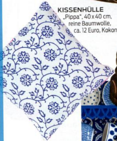
KISSENHÜLLE „Pippa“, 40 x 40 cm, reine Baumwolle, ca. 12 Euro, Kokon