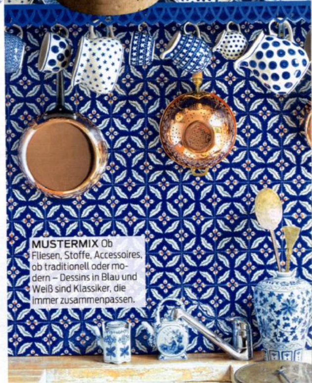
MUSTERMIX Ob Fliesen, Stoffe, Accessoires, ob traditionell oder modern – Dessins in Blau und Weiß sind Klassiker, die Immer zusammenpassen.