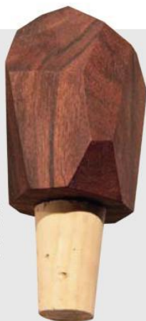
Rolha para garrafa Bottle Rock, de cortiça e nogueira, 6,35 x 3,81 cm de diâm., da Brush Factory, US$ 22; www.gnr8.biz