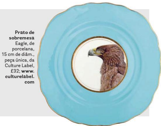
Prato de sobremesa Eagle, de porcelana, 15 cm de diâm., peça única, da Culture Label, £32; www.culturelabel.com