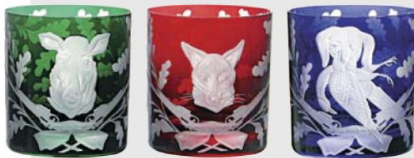
Copos Forest Folly, de cristal soprado e gravado à mão, 10 cm de alt., US$ 1.065,64 o jogo com seis; www.artedona.com

SEJA NO PREPARO DOS PRATOS, SEJA PARA SERVIR OU MESMO NA HORA DE LIMPAR A BAGUNÇA, OBJETOS CHEIOS DE GRAÇA LEVAM CHARME AO DÉCOR POR NATÁLIA MARTUCCI