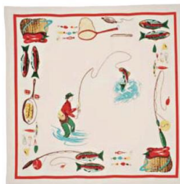
Toalha de mesa Bait Tackle, 100% algodão, 1,32 x 1,32 m, da Collector, R$ 59; www.collector55.com.br