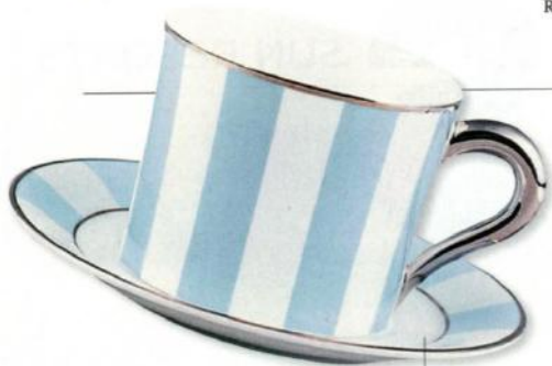
BERNARDAUD Tasse mit Unterteller „Galerie Royale“, € 105,88 www.artedona.com