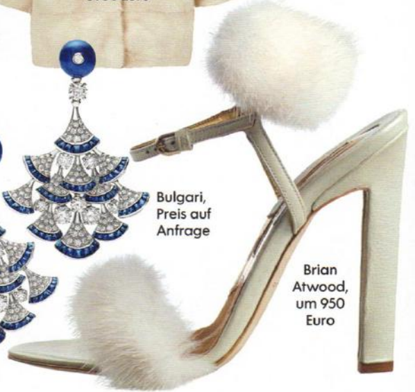
Brian Atwood, um 950 Euro