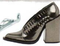
Jil Sander, um 545 Euro