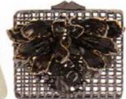
Roberto Cavalli, um 2440 Euro