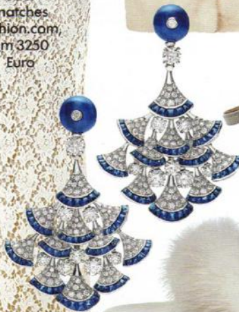
Bulgari, Preis auf Anfrage