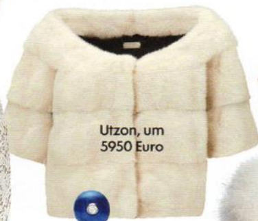
Utzon, um 5950 Euro