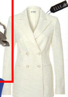
Philosophy di Alberta Ferretti, über emeza.de, um 790 Euro