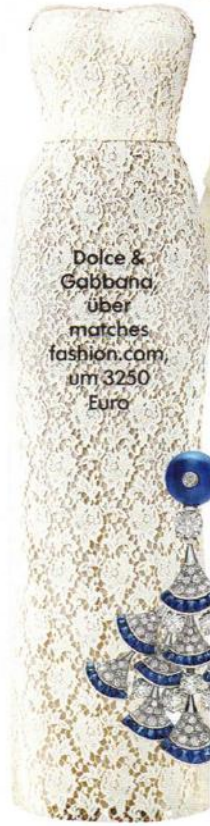
Dolce & Gabbana, über matches fashion.com, um 3250 Euro