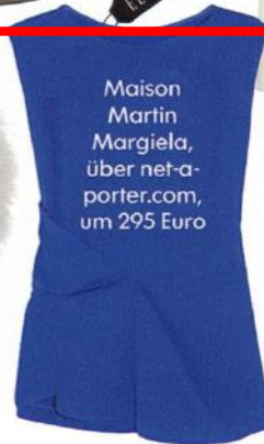
Maison Martin Margiela, über net-a- porter.com, um 295 Euro