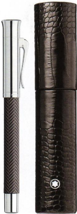
Edler Füller der Serie „Guilloché Ciselé“ mit Fischgratmuster und Goldfeder in 18 Karat, ca. 370 €, graf-von-faber-castell.com

In Zeiten von E-Mails wirkt ein handgeschriebener Brief wie ein persönliches Geschenk. Exquisite Utensilien adeln die neu entdeckte Schreibkultur