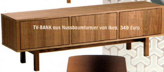
TV-BANK aus Nussbaumfurnier von Ikea, 349 Euro