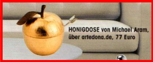
HONIGDOSE von Michael Aram, über artedona.de, 77 Euro