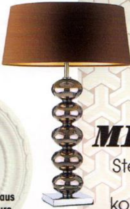
LEUCHE „Ballet Mirror“ von Heathfield, 617 Euro