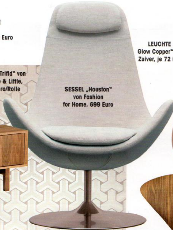
SESSEL „Houston“ von Fashion for Home, 699 Euro