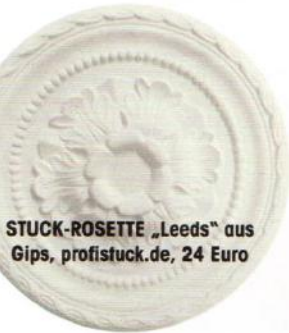
STUCK-ROSETTE „Leeds“ aus Gips, profistuck.de, 24 Euro