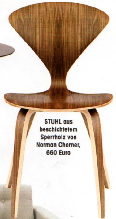
STUHL aus beschichtetem Sperrholz von Norman Cherner, 660 Euro

Stephanies Einrichtungsstil gefällt Ihnen? Hier kommen Anregungen, um den Look nachzustylen