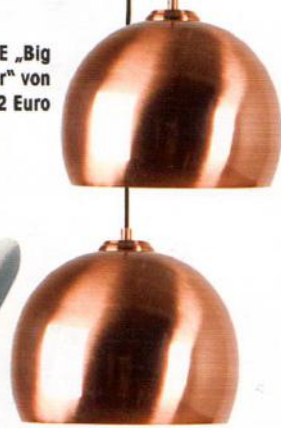
LEUCHE „Big Glow Copper“ von Zuiver, je 72 Euro