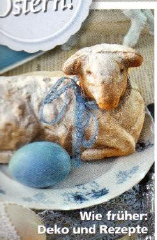
Wie früher: Deko und Rezepte