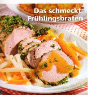
Das schmeckt: Frühlingsbraten