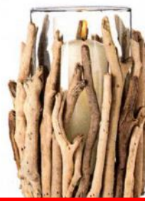
Windlicht aus Glas mit Treibholz, 26 cm hoch, 20 cm Ø, ca. 80 Euro, Impressionen

Leichtigkeit und Eleganz prägen diesen Wohn-Trend, der auf der Insel nahe New York berühmt wurde. Das Farbkonzept ist puristisch. Maximal drei Farben sollten ein Zimmer dominieren. Die wichtigste Farbe: Sanftes Weiß – Himmelblau und Korallenrot erinnern zusätzlich an Strand und Meer. Weiß lasierte Wände, weiße oder naturbelassene Möbel aus Korb und Holz setzen entspannte Akzente. Ebenso natürliche Stoffe wie weißes Leinen. Wunderschön: filigrane Muster auf Kissen und Porzellan, die maritime Motive wie Muscheln oder Seegras aufnehmen.