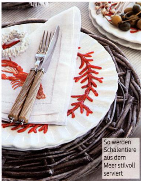
So werden Schalentiere aus dem Meer stilvoll serviert