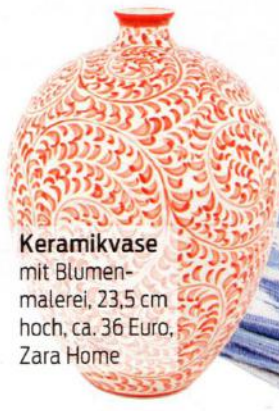
Keramikvase mit Blumenmalerei, 23,5 cm hoch, ca. 36 Euro, Zara Home