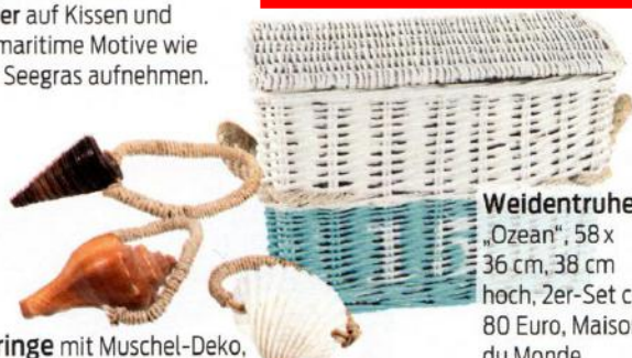
Serviettenringe mit Muschel-Deko, 4er-Set ca. 16 Euro, Zara Home