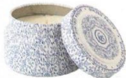
Kerzendose „Capri Blue“ , 40 Std. Brenndauer, 5 cm hoch, 7,6 cm Ø, ca. 14 Euro, Anthropologie