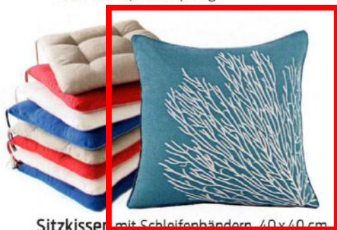
Sitzkissen mit Schleifenbändern, 40x40 cm, Baumwolle, ca. 15 Euro, Karstadt. Kissenbezug „Cavallò“ , Leinen, 45x45 cm, ca. 70 Euro, von Iosis über Artedona