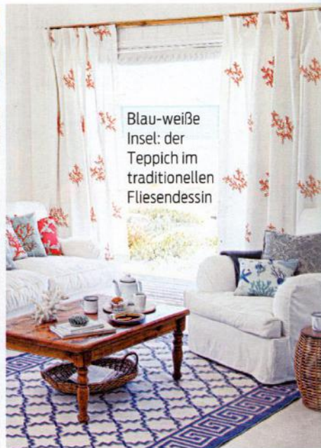
Blau-weiße Insel: der Teppich im traditionellen Fliesendessin