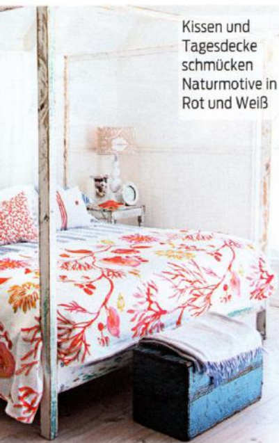
Kissen und Tagesdecke schmücken Naturmotive in Rot und Weiß