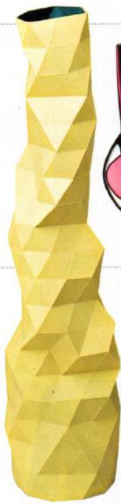
KNITTER-LOOK „Faceture“ in verschiedenen Größen und Farben von Phil Cuttance, ab ca. 290 € (Vitra Design Museum Shop)