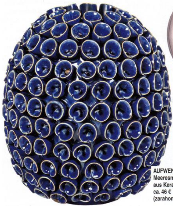
AUFWENDIG Meeresmotive aus Keramik, ca. 46 € ( zarahome.com )

AUSGEFALLENE Skulpturen, unendliche Formen- und Farbvielfalt – selbst ohne Blumen setzen diese Vasen besondere Akzente im Raum