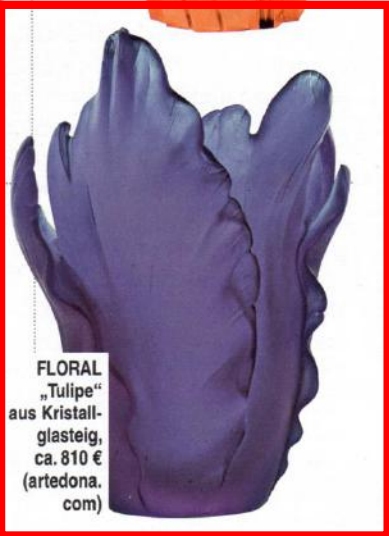
FLORAL „Tulpe“ aus Kristallglasteig, ca. 810 € ( artedona.com )