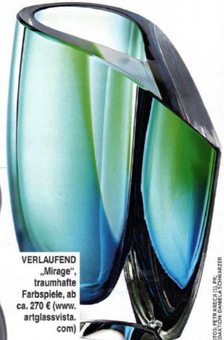
VERLAUFEND „Mirage“, traumhafte Farbspiele, ab ca. 270 € ( www.artglassvista.com )