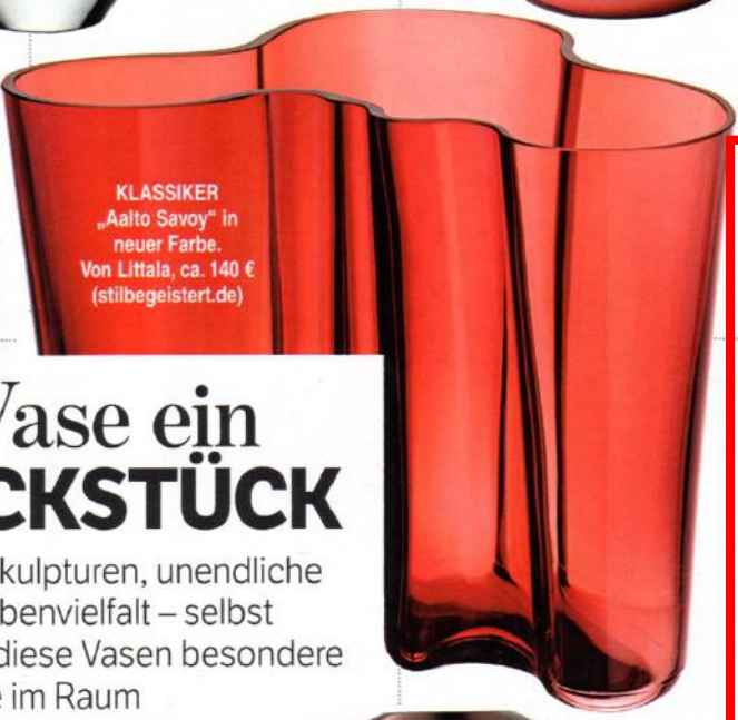
KLASSIKER „Aalto Savoy“ in neuer Farbe. Von Litala, ca. 140 € ( stilbegeistert.de )