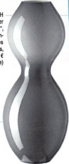
ORGANISCH aus der Serie „Coco“, durchgefärbtes Opalglas, ab ca. 18 € ( leonardo.de )