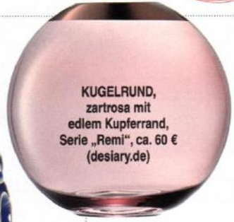
KUGELRUND , zartrosa mit edlem Kupferrand, Serie „Remi“, ca. 60 € ( desiary.de )