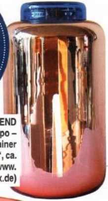
GLÄNZEND „Pulpo – Container Vase“, ca. 260 € ( www.connox.de )