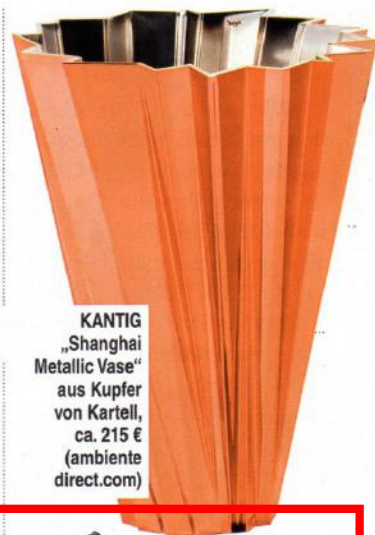
KANTIG „Shanghai Metallic Vase“ aus Kupfer von Kartell, ca. 215 € ( ambiente.direct.com )