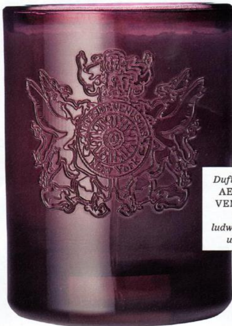
Duftkerze von AEDES DE VENUSTAS, über ludwigbeck.de, um 58 €