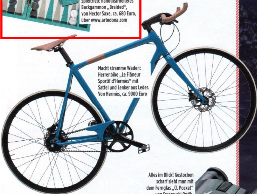
Macht stramme Waden: Herrenbike „Le Flâneur Sportif d'Hermès“ mit Sattel und Lenker aus Leder. Von Hermès, ca. 9000 Euro