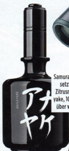
Samurai-Power: „Kuroi“ setzt auf Holz- und Zitrusnoten. Von Anna Yake, 100 ml, ca. 80 Euro, über www.douglas.de