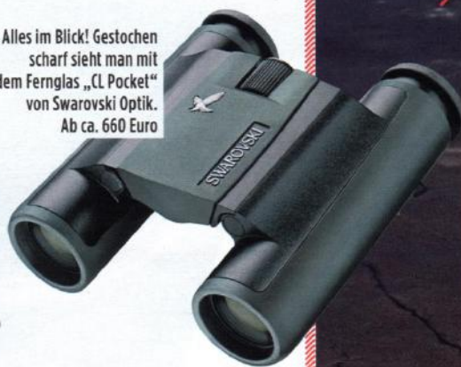
Alles im Blick! Gestochen scharf sieht man mit dem Fernglas „CL Pocket“ von Swarovski Optik. Ab ca. 660 Euro