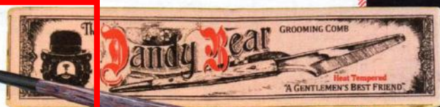
Perfekt in Form: Kamm „Gentlemen's Grooming Comb“, von The Dandy Bear, ca. 92 Euro, über www.ahalife.com