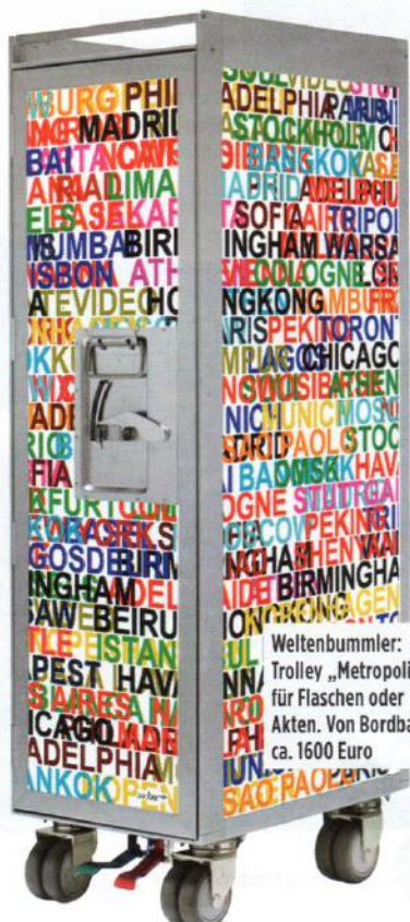
Weltenbummler: Trolley „Metropolitan“ für Flaschen oder Akten. Von Bordbar, ca. 1600 Euro