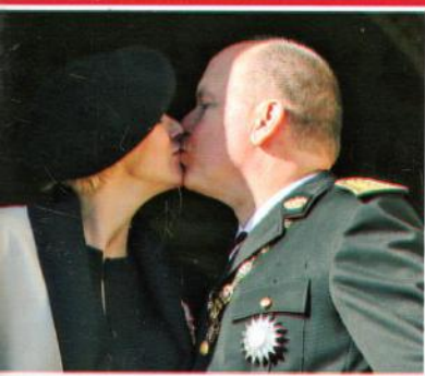
CHARLÈNE & ALBERT Der Countdown zur Geburt des Jahres