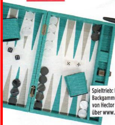
Spieltrieb: handgearbeitetes Backgammon „Braided“, von Hector Saxe, ca. 680 Euro, über www.artedona.com