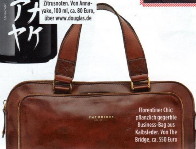
Florentiner Chic: pflanzlich gegerbte Business-Bag aus Kalbsleder. Von The Bridge, ca. 550 Euro