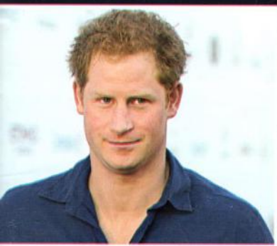
PRINZ HARRY GALA verbrachte eine Woche mit dem smarten Royal