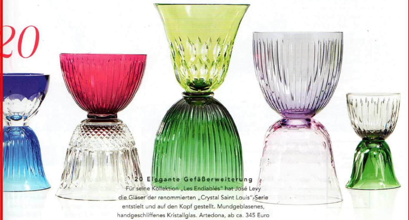
20 Elegante Gefäßerweiterung Für seine Kollektion „Les Endiablés“ hat José Levy die Gläser der renommierten „Crystal Saint Louis“-Serie entworfen und auf den Kopf gestellt. Mundgeblasenes, handgeschliffenes Kristallglas. Artedona, ab ca. 345 Euro