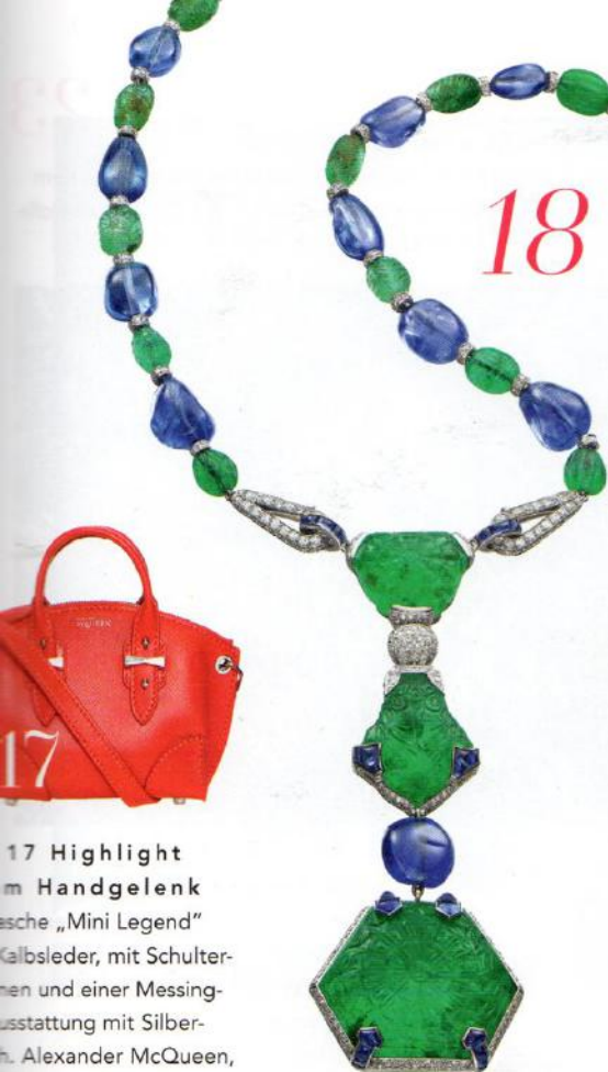
17 Highlight im Handgelenk Tasche „Mini Legend“ Kalbsleder, mit Schulter- riemen und einer Messing- ausstattung mit Silber- sch. Alexander McQueen, ca. 1045 Euro