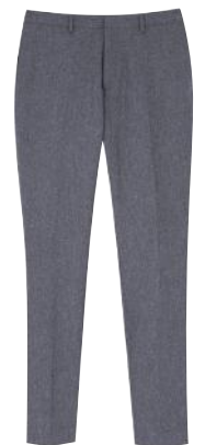
Grey Day: Hose aus der COS Essentials Seasonal Collection