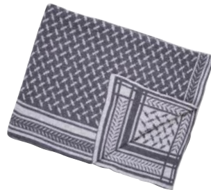
Kandidat zum Kuseln: Kaschmirdecke „Trinity Classic“ von Lala Berlin