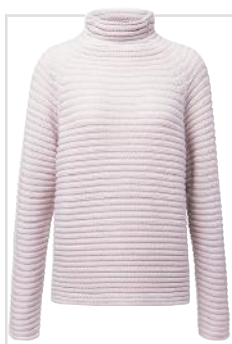
Woll-Lust: Pullover „Keel“ von Iris von Arnim