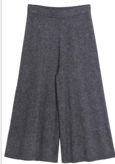
Weit und breit keine Sonne in Sicht: Hose von & Other Stories