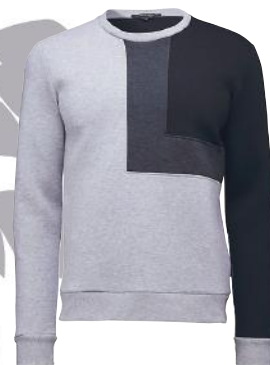
Alles im grauen Bereich: Pullover von Tiger of Sweden