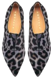
Leo macht lustig: Die Loafer sind von Unützer