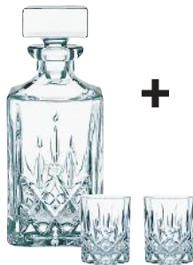
Klarer Fall: Karaffe und Whiskygläser von Nachtmann