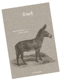
Grau und schlau: „Esel“ aus dem Matthes & Seitz Berlin Verlag