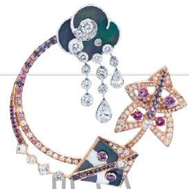
Icona in the sky with diamonds: Die „Cerfs-Volants“-Ohringe sind von van Cleef & Arpels