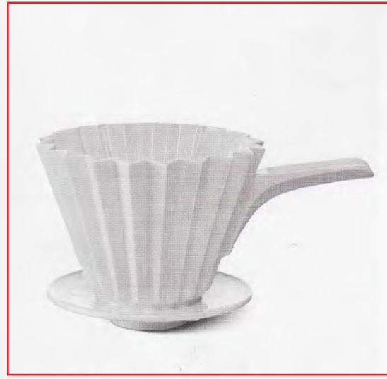
Türknauf von Ted Muehling, Porzellan auf gebürstetem Gold, Preis auf Anfrage (Nymphenburg/E.R.Butler). Cielo Schale aus Bisquitporzellan, perforiert, 274 Euro (Stefanie Hering). Kaffeefilter #4 von Thomas Wenzel, doppelwandiges Porzellan, 195 Euro (KPM).