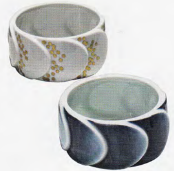
Pyramide Wandfliese, Porzellan, 22,5 x 15 cm, 150 Euro/Stück (Meissen). Neuseeland Vase von Jonathan Radetz, Porzellan, 178 Euro (Dua). 2016/ Armreife von Saskia Diez, Porzellan und von Hand bemalt mit japanischen Motiven, ab November, Preis auf Anfrage (2016arita).