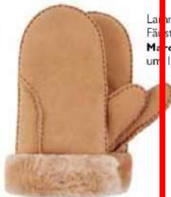
Lammfell-Fäustlinge, von Marc Cain , um 100 Euro