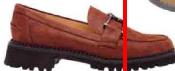
Lederloafer mit Spange, von Brunato , um 280 Euro