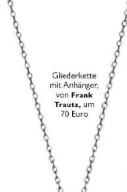
Gliederkette mit Anhänger, von Frank Trautz , um 70 Euro