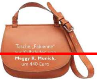
Tasche „Fabienne“ aus Kalfellen, von Meggy K. Munich , um 440 Euro