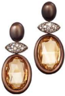
Ohrhinge „Smoky“ mit Rauchquarzbrillets und braunen Diamanten, von Thomas Jürgens Juwelenschmiede , um 27.500 Euro