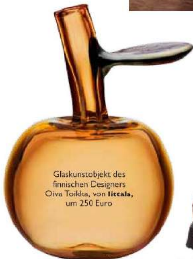
Glaskunstobjekt des finnischen Designers Oiva Toikka, von Iittala , um 250 Euro