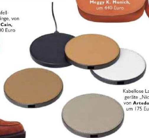
Kabellose Ladegeräte „Nick“, von Artedona , um 175 Euro