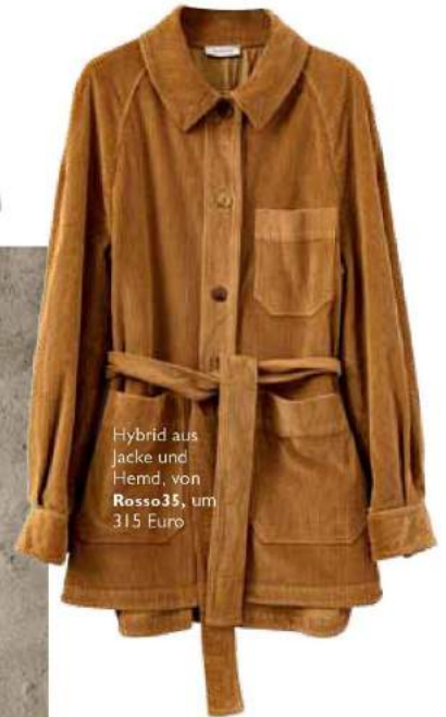
Hybrid aus Jacke und Hemd, von Rosso35 , um 315 Euro