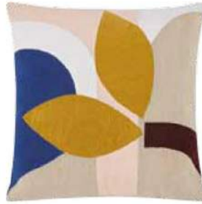
Kissenbezug aus organischer Baumwolle, von Lanua , um 40 Euro