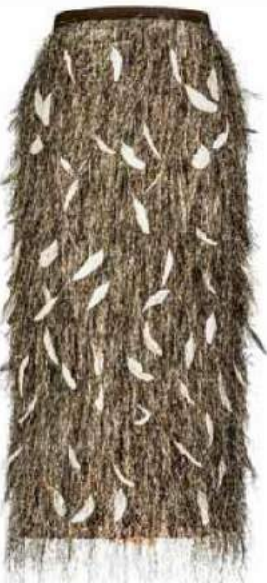
Rock aus Lamé mit Federn und Swarovski-Steinchen, von ICI Maintenant , um 1745 Euro