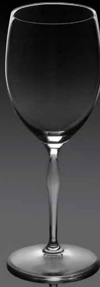
Verre à Champagne. Champagne glass.