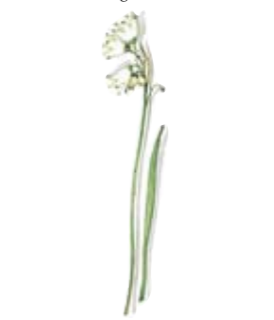
Sonnen-Knotenblume Platte oval groß Snowflake Oval Platter large Schneebere Pfefferstreuer Snowberry Pepper Shaker