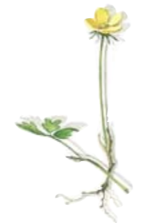
Gold-Fingerkraut Kanne klein Five-finger Pot small