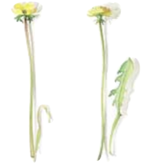
05 Winterling 05 Goldenthrum 06 Gemeiner Löwenzahn 06 Common dandelion