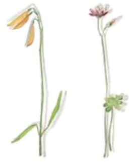
01 Waldblatterbse 01 Wood pea 02 Storchschnabel 02 Geranium