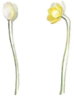
01 Scheidiges Wollgras 01 Sheath-flowering grass 02 Knolliger Hahnenfuß 02 Buttercup