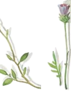
Moosbeere Salzstreuer Mossberry Salt Shaker Knollen-Kratzdistel Leuchter Plumed thistle Candlestick