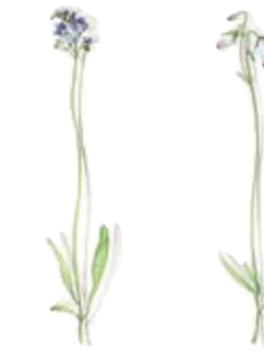
05 Sumpf-Vergißmeinnicht 05 Bog forget-me-not 06 Glockenblume 06 Bellflower