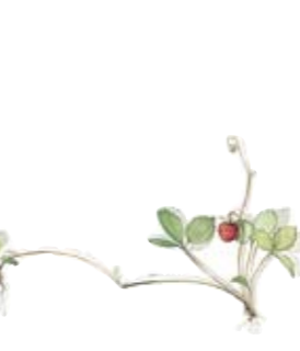
Walderdbeere Ragout Deckel Woodland strawberry Covered Vegetable Dish Lid