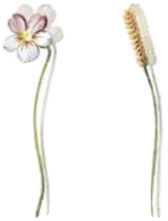
03 Wildes Stiefmütterchen 03 Wild violet 04 Wiesen-Knöterich 04 Knotweed