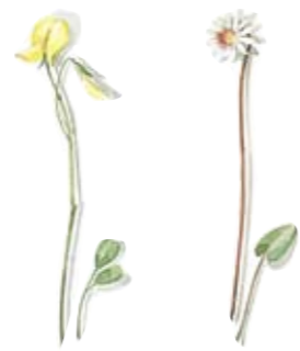
05 Blasenstrauch 05 Bladder-sema 06 Zwerg-Alpenglöckchen 06 Sea-bindweed