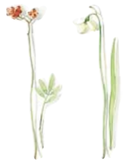
01 Vogelbeere 01 Dogberry 02 Schneeglöckchen 02 Snowdrop