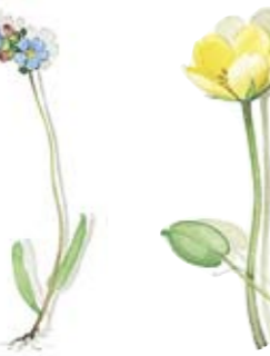
03 Lungenkraut 03 Lungwort 01 Seekanne 01 Floating-heart