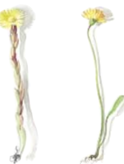
03 Huflattich 03 Coltsfoot 04 Kleines Habichtskraut 04 Miniature hawkweed