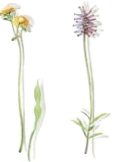
03 Habichtskraut 03 Hawkweed 04 Schnee-Heide 04 Snow heather