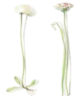
03 Silberwurz 03 Dryas 04 Rosen-Lauch 04 Rosy-flowered garlic