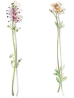
05 Gemeiner Erdrauch 05 Earth-smoke 06 Acker-Gauchheil 06 Pimpernel