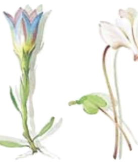
02 Lungen-Enzian 02 Gentian 03 Alpenveilchen 03 Cyclamen