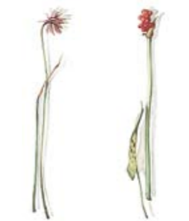
03 Schnittlauch 03 Chives 04 Gefleckter Aronstab 04 Spotted Arum