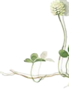
Weiß-Klee Zuckerdose Deckel White clover Sugar Bowl Lid