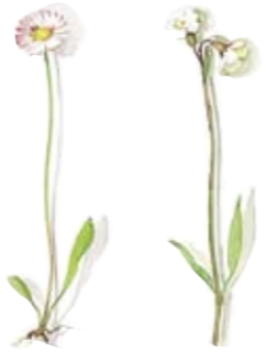
05 Gänseblümchen 05 Daisy 06 Lichtnelke 06 Campanion