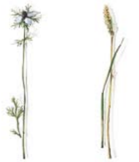
05 Damsener Schwarzkümmel 05 Damascene Black Caraway 06 Strand-Wegerich 06 Beach Plantain