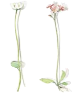
01 Sumpferblatt 01 Bog-stars 02 Leberbalsam 02 Floss flower