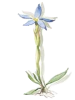
Frühlings-Enzian Sahnegießer Spring gentian Creamer