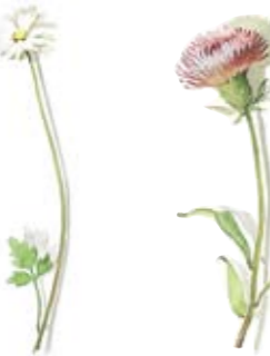
06 Appinen-Windröschen 06 Anemone 04 Flockenblume 04 Star-thistle