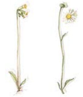
01 Wiesen-Schlüsselblume 01 Meadow Cowslip 02 Wiesen-Margerite 02 Meadow Daisy