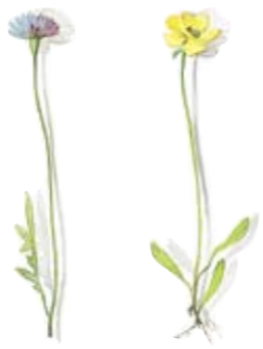
01 Blauer Lattich 01 Blue milkweed 02 Sonnenröschen 02 Rockrose