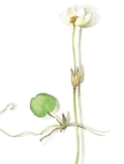
Froschbiß Kanne groß Frogbite Pot large