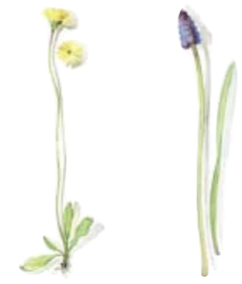
01 Steinhaariger Löwenzahn 01 Fall dandelion 02 Traubenhyazinthe 02 Ambrosia hyacinth