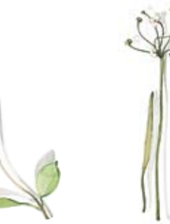
Igelschlauch Saftkrug Lesser Water Plantain Juice Pitcher