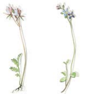
01 Reiherschnabel 01 Storksbill 02 Faden-Ehrenpreis 02 Cotton-rose