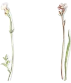
Gemeines Leimkraut Salatschale groß Catchfly Salad Bowl large Pechnelke Beilageschale, Sauciere Untere German catchfly Vegetable Dish, Gravy Boat