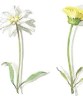
05 Edelweiß 05 Edelweiss 06 Ferkelkraut 06 Cat's ear