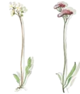
03 Alpen-Gänsekresse 03 Rock-cress 04 Rote Spornblume 04 Sweet Betsy