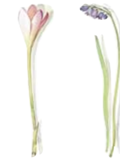
03 Herbstzeitlose 03 Colchium 04 Hasenglöckchen 04 Hyacinth