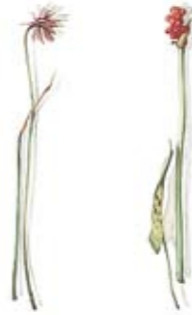
03 Schnittlauch 03 Chives 04 Gefleckter Aronstab 04 Spotted Arum