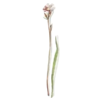
Gemeines Leimkraut Salatschale groß Catchfly Salad Bowl large Pechnelke Beilageschale, Sauciere Untere German catchfly Vegetable Dish, Gravy Boat