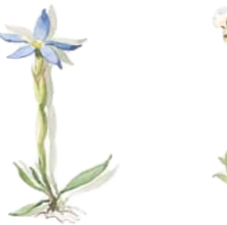
Frühlings-Enzian Sahnegießer Spring gentian Creamer