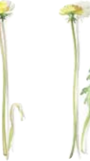
05 Winterling 05 Goldenthrum 06 Gemeiner Löwenzahn 06 Common dandelion