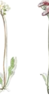
03 Alpen-Gänsekresse 03 Rock-cress 04 Rote Spornblume 04 Sweet Betsy