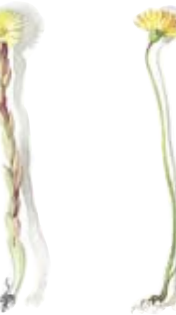
03 Huflattich 03 Coltsfoot 04 Kleines Habichtskraut 04 Miniature hawkweed