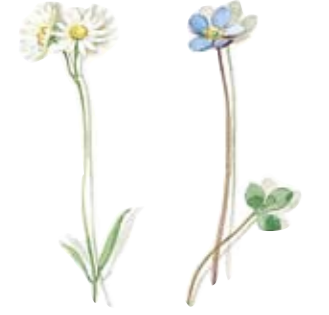
03 Steinmiere 03 Chickweed 04 Leberblümchen 04 Liverleaf