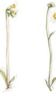
01 Wiesen-Schlüsselblume 01 Meadow Cowslip 02 Wiesen-Margerite 02 Meadow Daisy