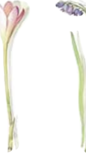
03 Herbstzeitlose 03 Colchium 04 Hasenglöckchen 04 Hyacinth