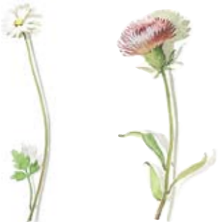
06 Appinen-Windröschen 06 Anemone 04 Flockenblume 04 Star-thistle