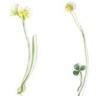
04 Wald-Goldstern 04 Lily 05 Hopfen-Luzerne 05 Hops