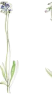
05 Sumpf-Vergißmeinnicht 05 Bog forget-me-not 06 Glockenblume 06 Bellflower