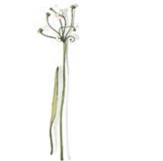
Schneebeere Pfefferstreuer Snowberry Pepper Shaker Igelschlauch Saftkrug Lesser Water Plantain Juice Pitcher