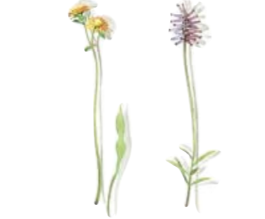
03 Habichtskraut 03 Hawkweed 04 Schnee-Heide 04 Snow heather