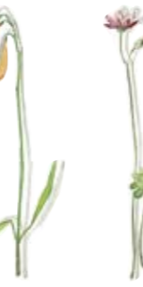
01 Waldblatterbse 01 Wood pea 02 Storchschnabel 02 Geranium