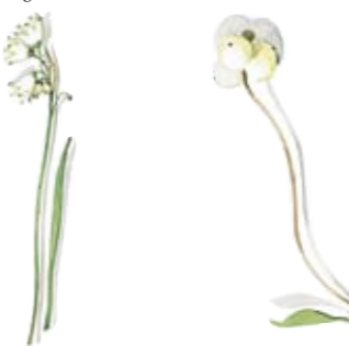
Sonnen-Knotenblume Platte oval groß Snowflake Oval Platter large