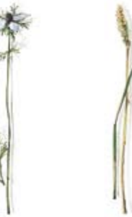
05 Damsener Schwarzkümmel 05 Damascene Black Caraway 06 Strand-Wegerich 06 Beach Plantain