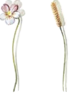
03 Wildes Stiefmütterchen 03 Wild violet 04 Wiesen-Knöterich 04 Knotweed