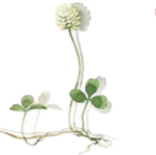
Weiß-Klee Zuckerrose Deckel White clover Sugar Bowl Lid