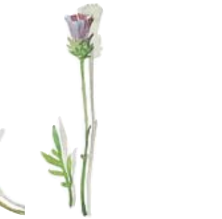
Moosbeere Salzstreuer Mossberry Salt Shaker Knollen-Kratzdistel Leuchter Plumed thistle Candlestick