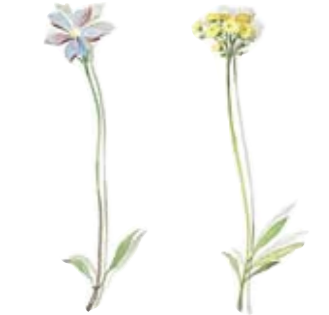
05 Kleines Immergrün 05 Periwinkle 06 Berg-Steinkraut 06 Alyssum