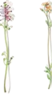
05 Gemeiner Erdrauch 05 Earth-smoke 06 Acker-Gauchheil 06 Pimpernel