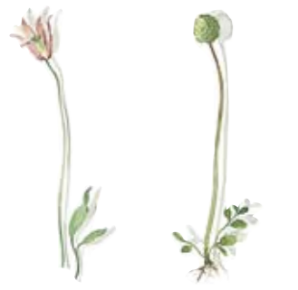
01 Alpen-Waldrebe 01 Clematis 02 Kleiner Wiesenknopf 02 Burnet