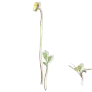
Acker-Witwenblume Salatschale klein Knautia Salad Bowl small Nelkenwurz Platte oval, klein Pinkroot Oval Platter small