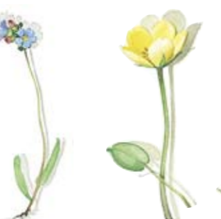
03 Lungenkraut 03 Lungwort 01 Seekanne 01 Floating-heart