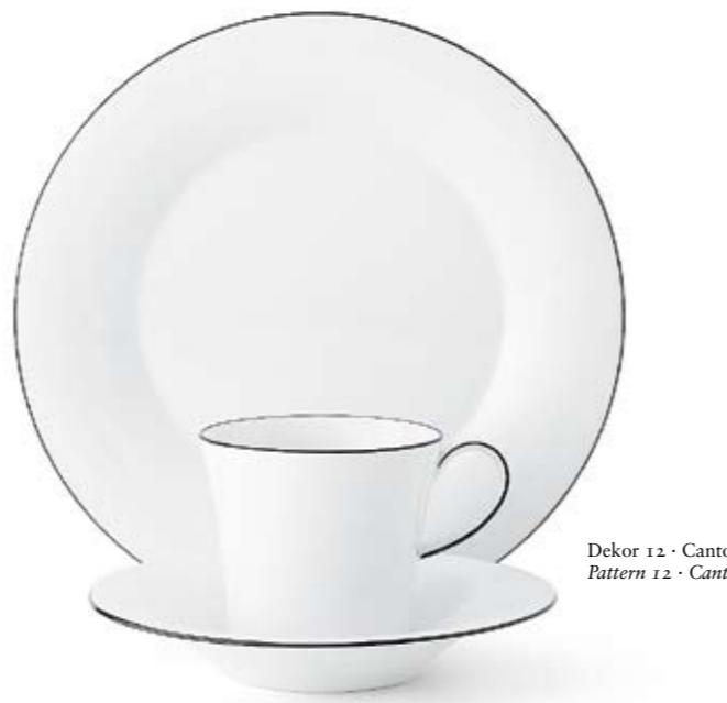
Dekor 12 · Canto Pattern 12 · Canto