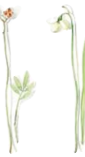
01 Vogelbeere 01 Dogberry 02 Schneeglöckchen 02 Snowdrop