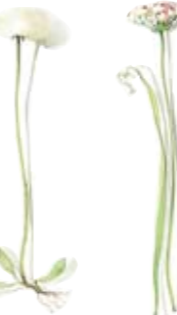
03 Silberwurz 03 Dryas 04 Rosen-Lauch 04 Rosy-flowered garlic