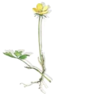
Gold-Fingerkraut Kanne klein Five-finger Pot small