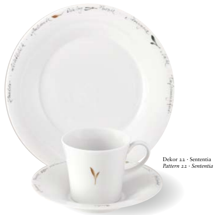
Dekor 22 · Sententia Pattern 22 · Sententia