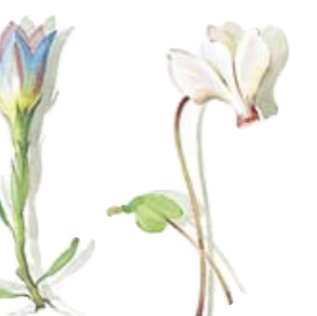
02 Lungen-Enzian 02 Gentian 03 Alpenveilchen 03 Cyclamen