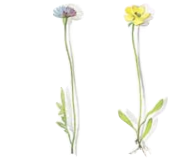
01 Blauer Lattich 01 Blue milkweed 02 Sonnenröschen 02 Rockrose