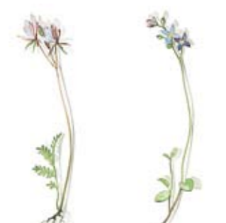
01 Reiherschnabel 01 Storksbill 02 Faden-Ehrenpreis 02 Cotton-rose