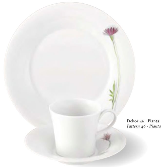
Dekor 46 · Pianta Pattern 46 · Pianta

Pattern 00 - white Pattern 12 - Canto, black rim Pattern 22 - Sententia delicate hand-painted petals circumscribed with charming words Pattern 46 - Pianta soft meadow flowers, hand-drawn on-glaze Children's set Pattern 14 - decorated Pattern 22 - bowl - white with individual inscription à la Sententia Pattern 23 - cup - decorated with individual name à la Sententia bowl - decorated with individual inscription à la Sententia