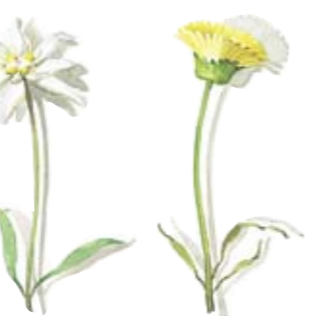
05 Edelweiß 05 Edelweiss 06 Ferkelkraut 06 Cat's ear