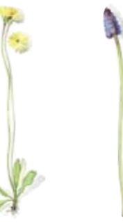
01 Steinhaariger Löwenzahn 01 Fall dandelion 02 Traubenhyazinthe 02 Ambrosia hyacinth