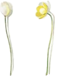
01 Scheidiges Wollgras 01 Sheath-flowering grass 02 Knolliger Hahnenfuß 02 Buttercup