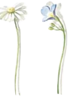
05 Hundskamille 05 Dog fennel 06 Dauer-Lein 06 Flax