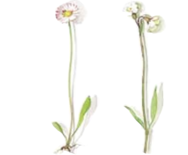
05 Gänseblümchen 05 Daisy 06 Lichtnelke 06 Campanion