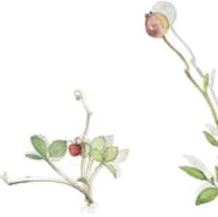
Walderdbeere Ragout Deckel Woodland strawberry Covered Vegetable Dish Lid