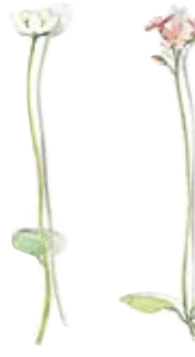
01 Sumpferblatt 01 Bog-stars 02 Leberbalsam 02 Floss flower