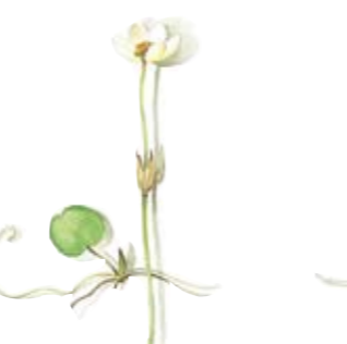
Froschbiß Kanne groß Frogbite Pot large